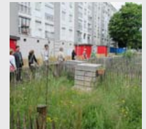
Jardiner la ville - Nantes

Des ateliers régionaux en Normandie avec Florysage et en Rhône-Alpes-Auvergne avec Echos-Paysage