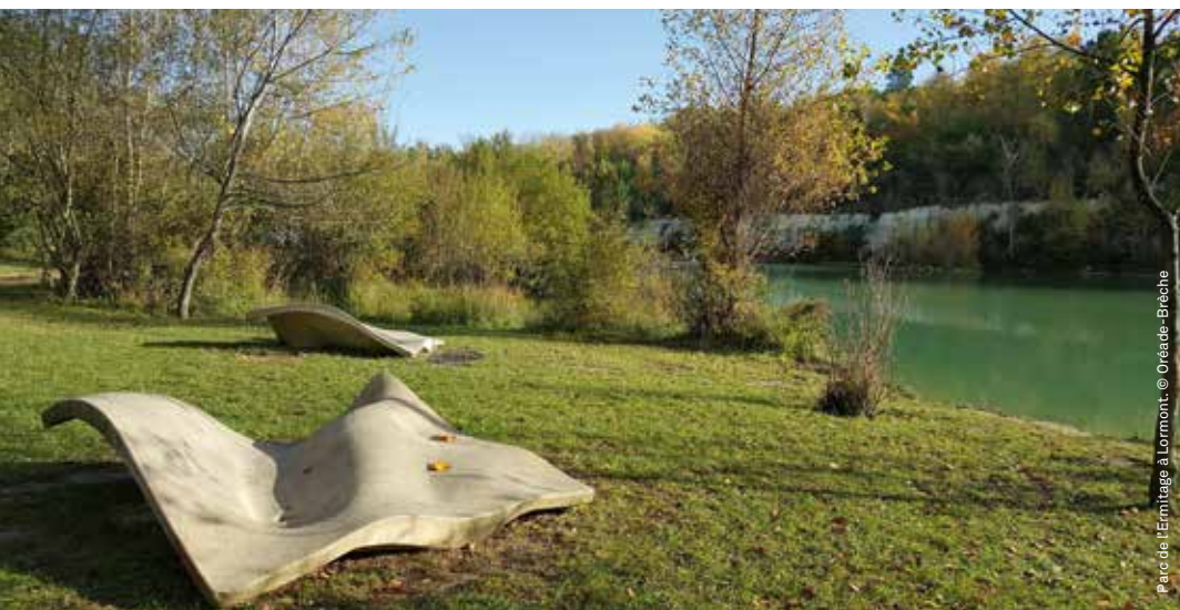
Parc de l'Ermitage à Lormont.

L'engagement vers une gestion écologique constitue un véritable changement de paradigme tant pour les gestionnaires que pour les usagers de ces espaces. Elle nécessite un nouveau regard, notamment sur la flore spontanée et les insectes, mais aussi le développement de nouvelles compétences pour les jardiniers.